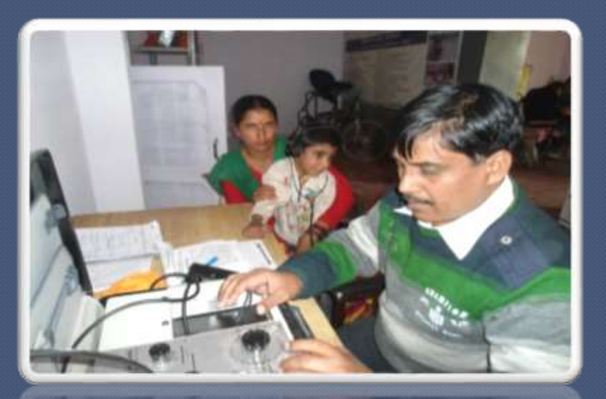
PIC. NO 13 Early intervention techniques by CRC.