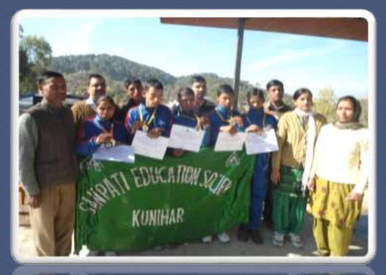
PIC. NO.39 group of children after winning in games.