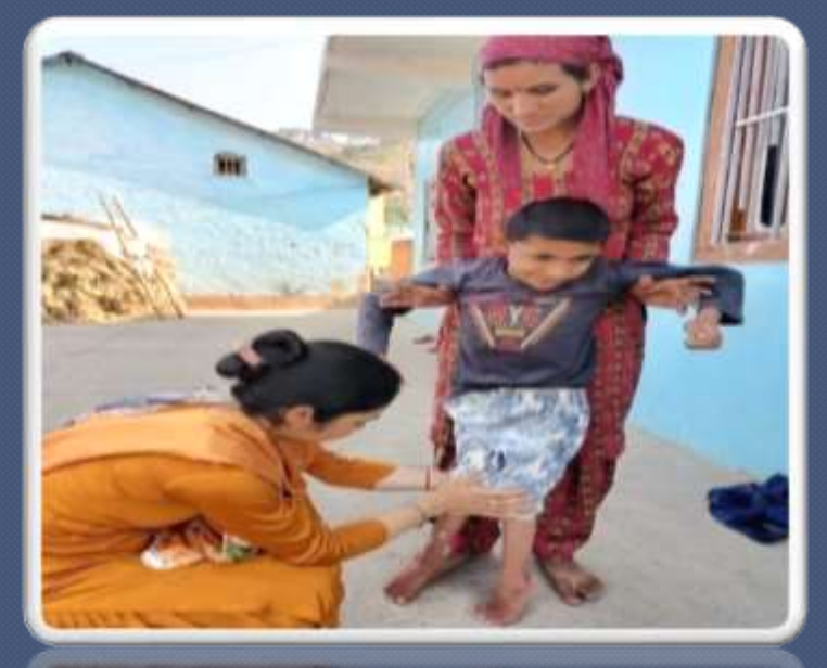
PIC. NO 23 follow up by spl educators