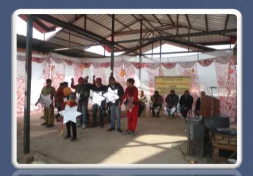
PIC. NO.41 dance activity in our NGO by spl children.