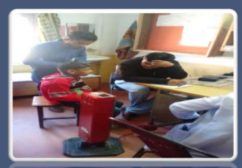
PIC. NO. 27 Regular medical check up in local civial hospital