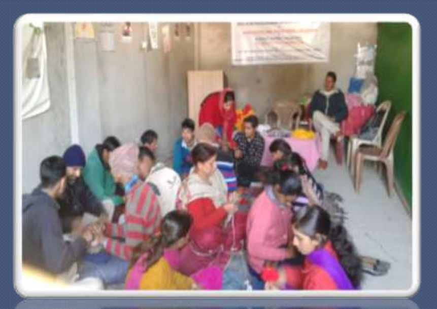
PIC. NO.35 skill like toy making ,jute bag ,paper bag by HIMCOM shimla