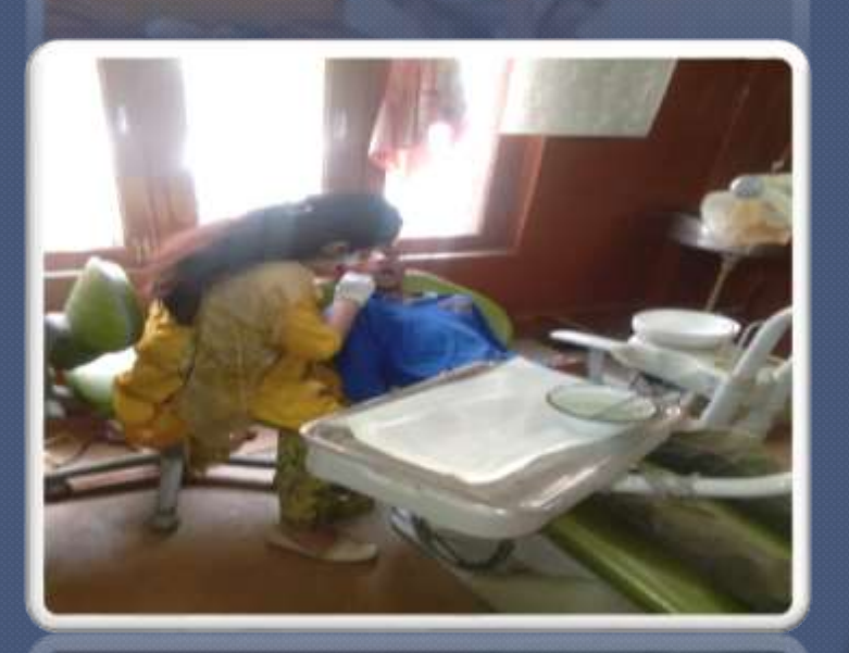
PIC. NO 24 regular dental check up in local hospital.