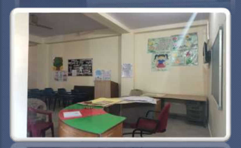
PIC. NO. 15 inner view of day care centre

Disha cum vikas: This is combination of two scheme disha and vikas serving for different age group. disha scheme is meant for the age to 10 years for national trust disabilities intellectual disabilities, cerebral palsy ,autism and multiple disabilities . This particular scheme is funded by national trust but fund only for categories BPL and LIG not for non LIG. Initially national trust run these schemes separately but now due to lack of funds national trust has clubbed in only one scheme Disha cum vikas.