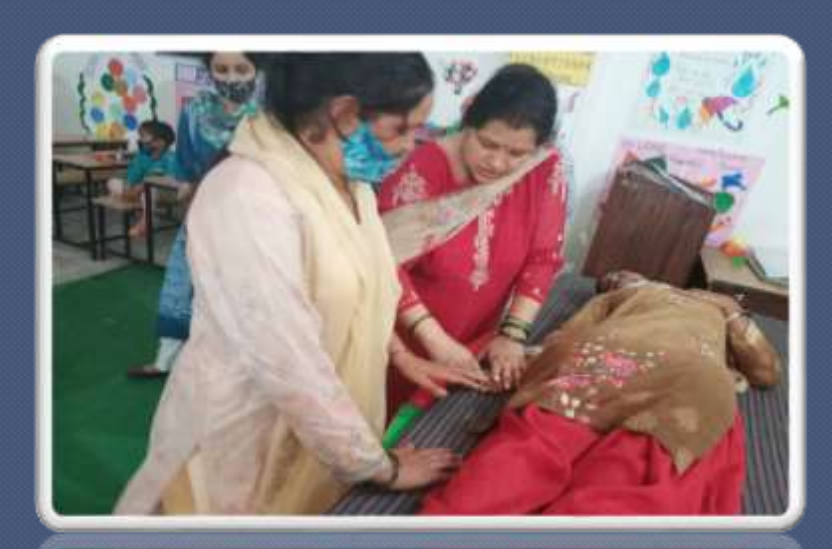
PIC. NO 22 physiotherapy in the presence of mother for follow up.