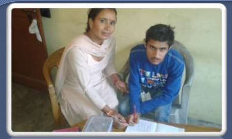
PIC. NO. 2 Home visits by spl educators