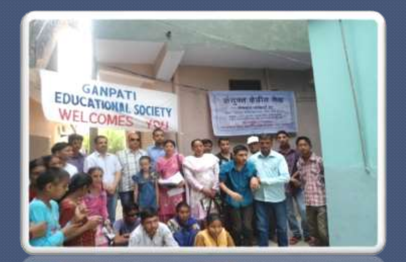
PIC. NO. 44 joint camp with experts in physiotherapy, psychlogist, growth and development CRC sunder nagar.