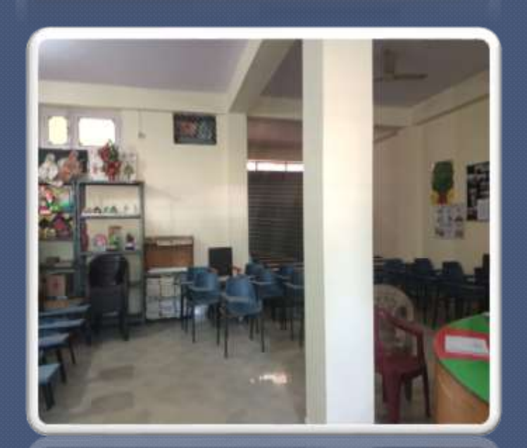
PIC. NO 16 inner view of the day care centre.