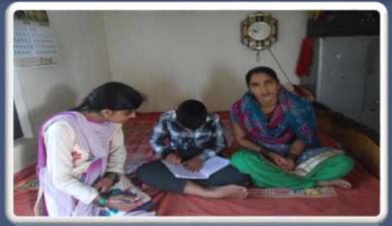
PIC. NO. 3 Participation of parents in home visits.

3. Visit based services are providing by special educators registered under RCI.