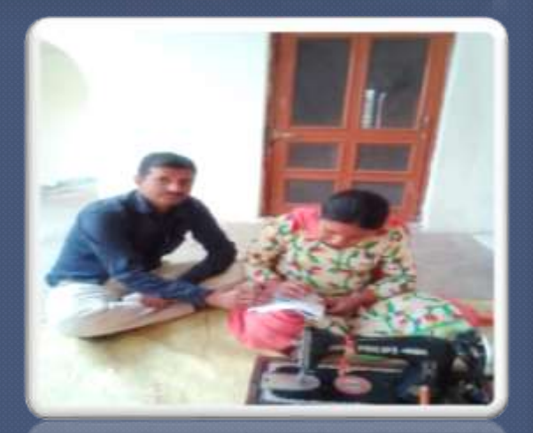
PIC. NO 18 learning skill of stitching.

7. Regular counseling of parents and guardians for achieving goals for the growth of child.