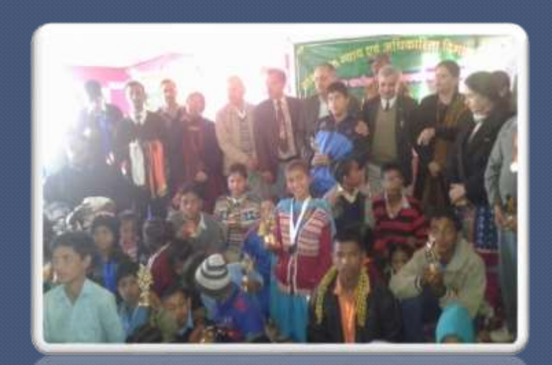
PIC. NO. 43 On world disability day with DC solan ,DD education ,DWO solan ,DIET principal , DPO our NGO representative with cwsn in solan.