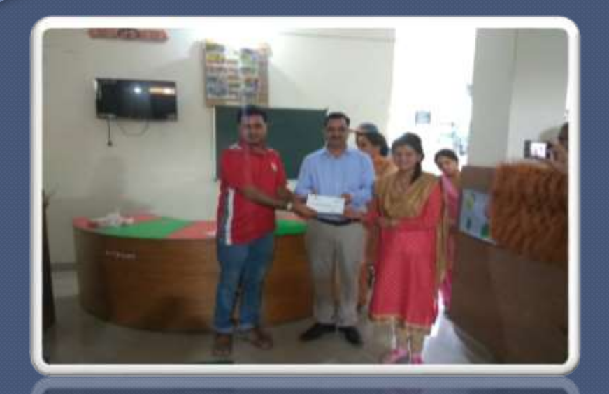
PIC. NO. 30 certificate distribution by CORD Dharamshala (SNAC NT) for shayogi trainee