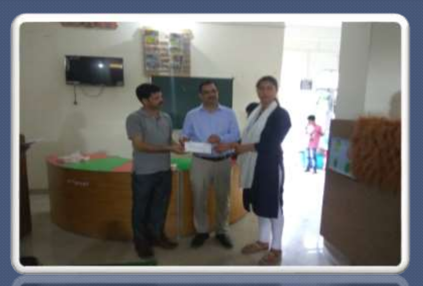
PIC. NO. 31 shayogi trainee receives certificates.