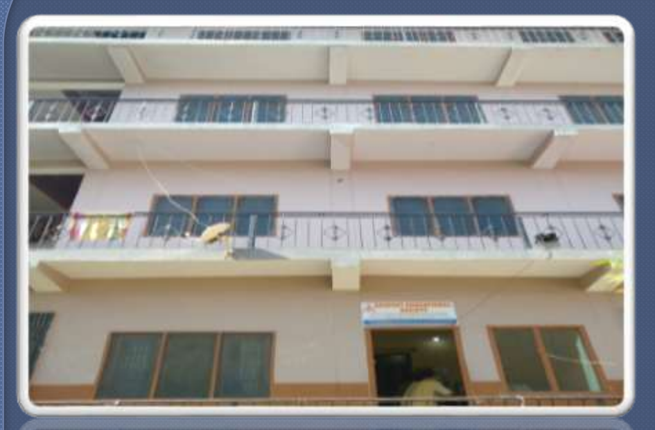
PIC. NO.1 showing building structure of organisation in kunihar

Ganpati Educational Society is a not – for – profit, non – political, and a non – religious society registered under societies act XXI/1860 on 04 – 12 – 2003 . Since its incorporation" G.E.S. " has been working on real grass root levels on issues related to care of Divyangjan and disabilities in all