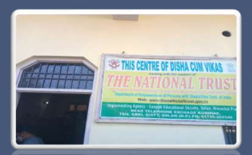
PIC. NO 14 day care centre Disha cum vikas .