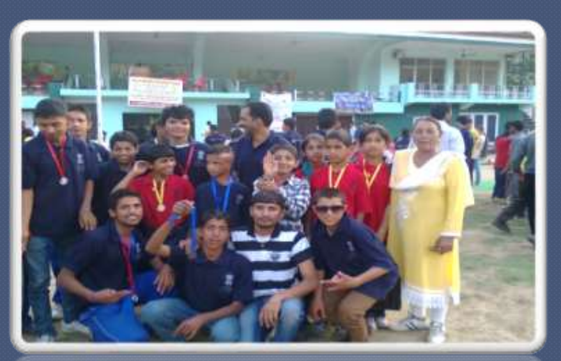
PIC. NO. 9 coach and our athlete in state level games.