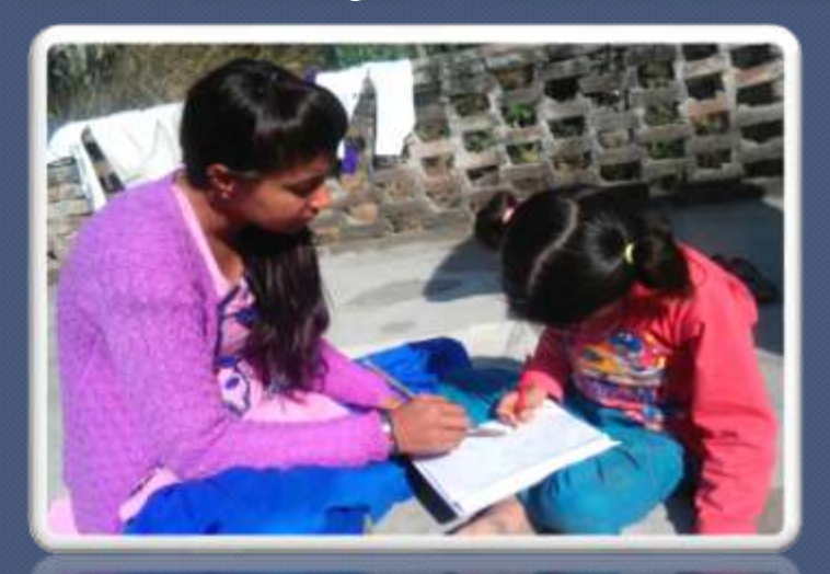
PIC. NO. 5 home based education for beginners.