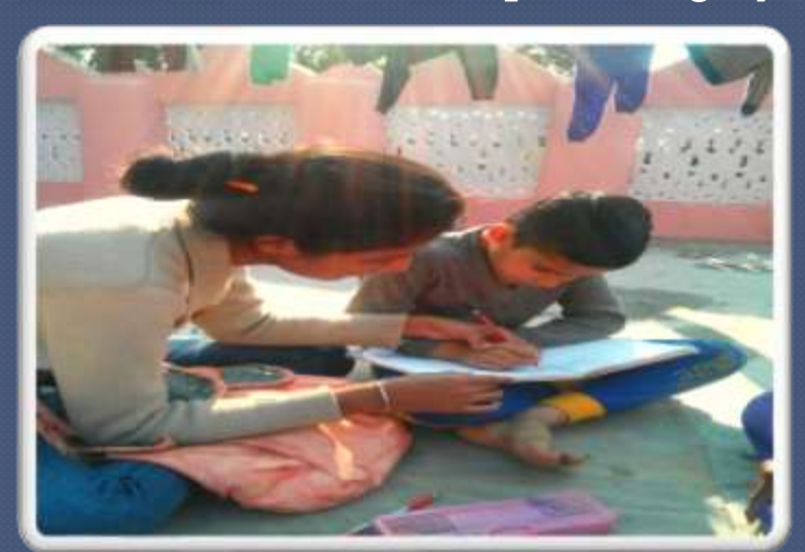
PIC. NO.4 spl educators helping the child in skill.

3. Visit based services are providing by special educators registered under RCI.