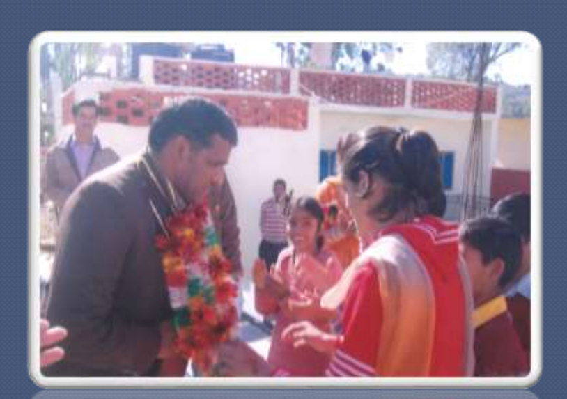
PIC. NO 40 representative from welfare deptt in one of the cultural activity in our centre.