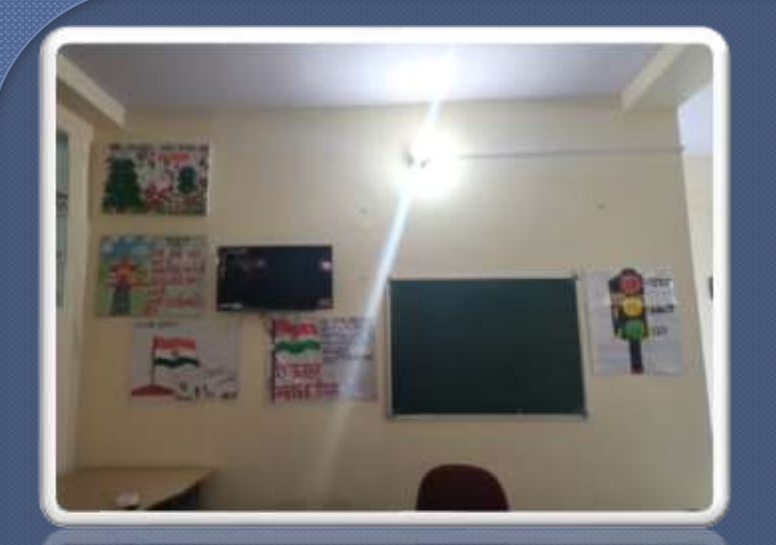
PIC. NO 16 view of class room.