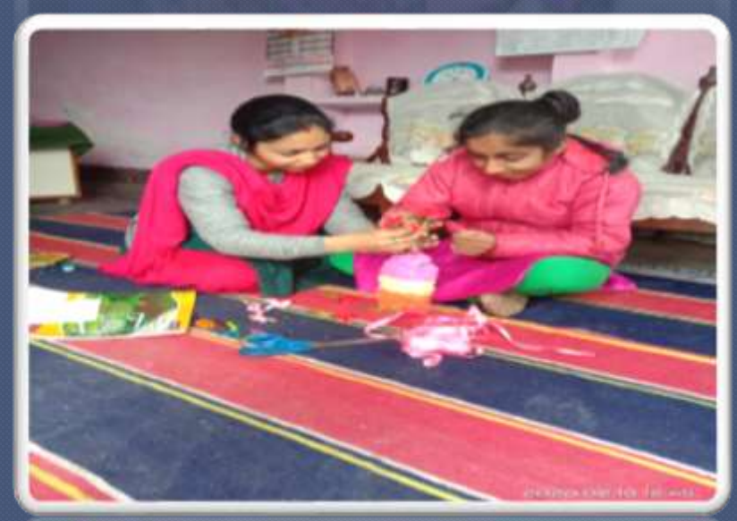
PIC. NO. 38 girl learning skill of flower making under Home based visits by spl educators.