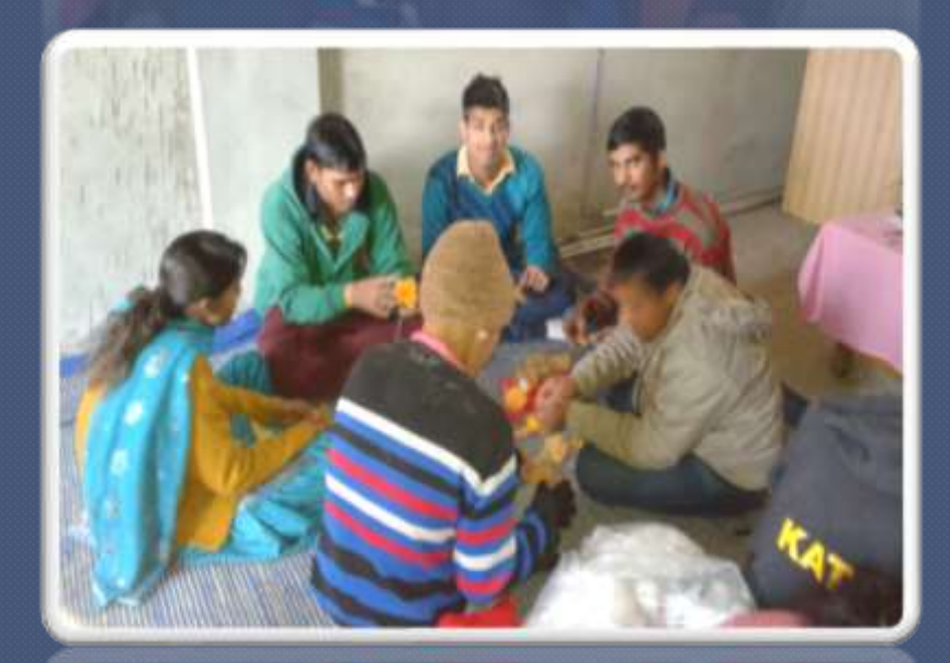
PIC. NO 37 PWD learning skill in our NGO.