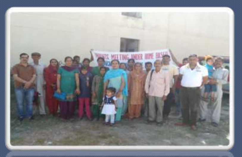
PIC. NO. 7 parents meeting of children with spl needs.